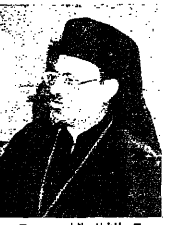
المطران بلاشا يصرح